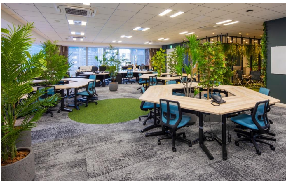
写真) 環境配慮を意識して緑を取り入れた執務スペース

本社移転を通じて、RE100電力が掲げる「ソーシャルビジネスで地球環境を変える。」という企業ミッションのもと、太陽光発電をはじめとした再生可能エネルギーの創出・制御・提供や環境価値利用を促す取り組みを加速させ、事業体制の強化を図ります。